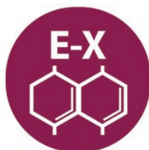
Dióxido Enxofre e Sulfitos