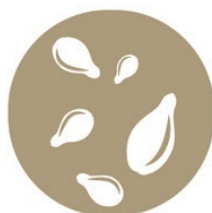
Grão de Sésamo